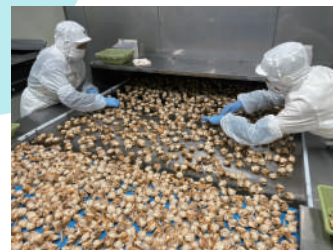
トンネルフリーザー急速凍結の様子

納入させていただいたのはスチールベルトタイプのトンネルフリーザーで機械の大きさは既存フリーザーと同じでしたが凍結時間が大幅に短縮し、生産量を 2 倍にすることができました。またフリーザー搬出後のホタテの凍結品質も向上し、生産能力と凍結品質が共に改善されました。